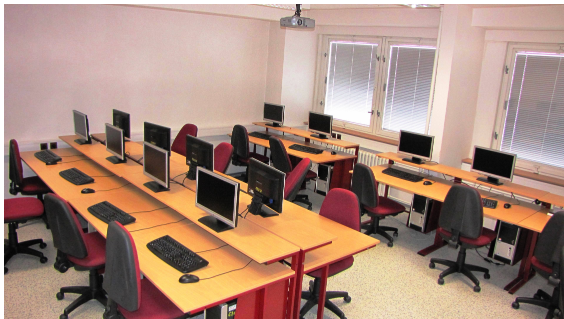
Učebna výpočetní techniky E516 s dataprojektorem