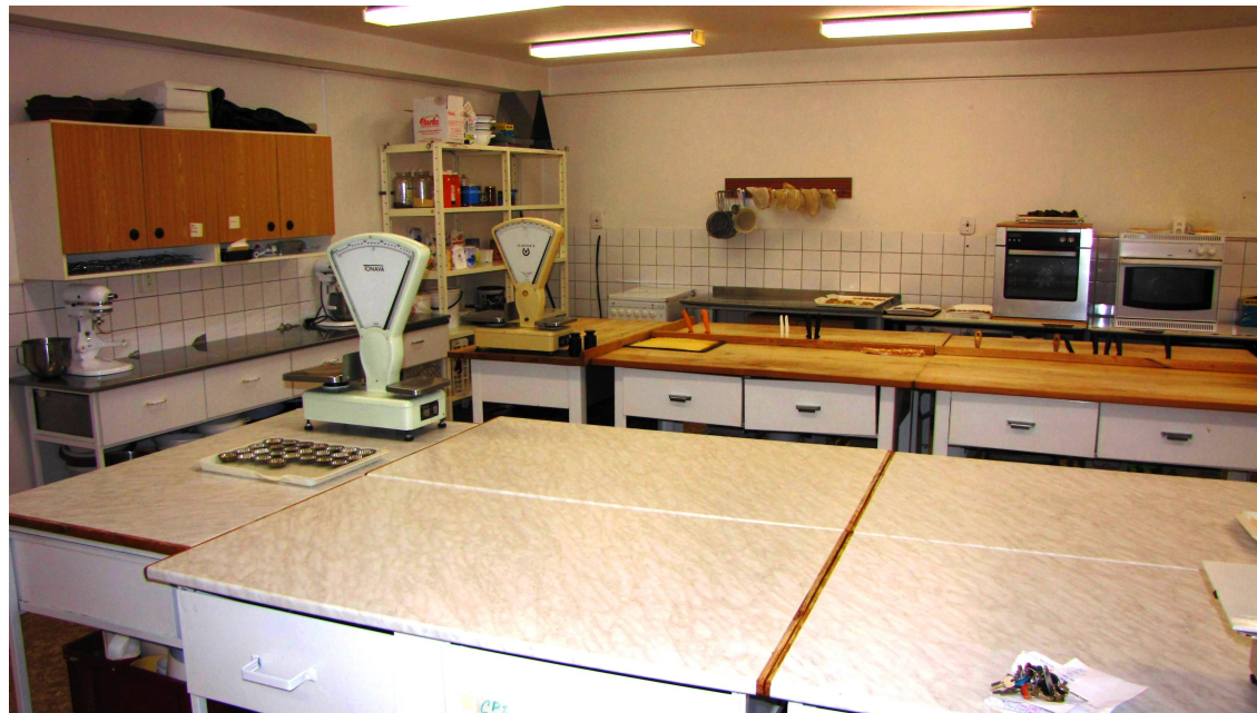
Učebna praktické výuky C001